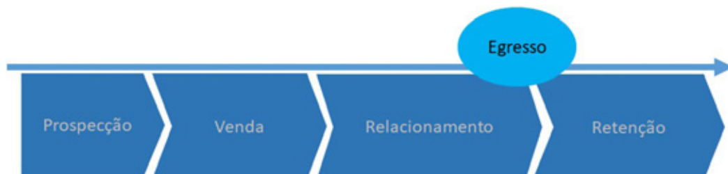
Figura 1: Ciclo de vida do acadêmico

Ciclo de vida do acadêmico e pesquisas: a UNIASSELVI faz consideráveis investimentos em pesquisas de mercado e mapeamento do ciclo de vida de seus acadêmicos (Figura 1), desde o momento em que são candidatos, durante todo o desenvolvimento de seu curso superior e após sua formatura, visando, dentre outras questões, compreender quais são as melhores políticas de integração da instituição com os públicos que afetam a completa formação e satisfação de seus acadêmicos.